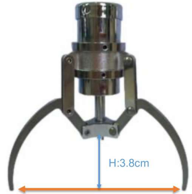
W:13cm 上部・標準アーム