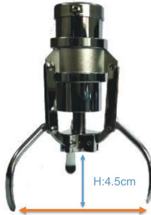
W:12cm 下部・標準アーム